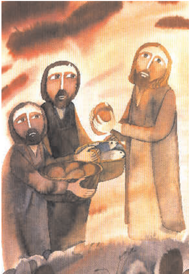
Johannes 6:1-15, de wonderbaarlijke spijziging